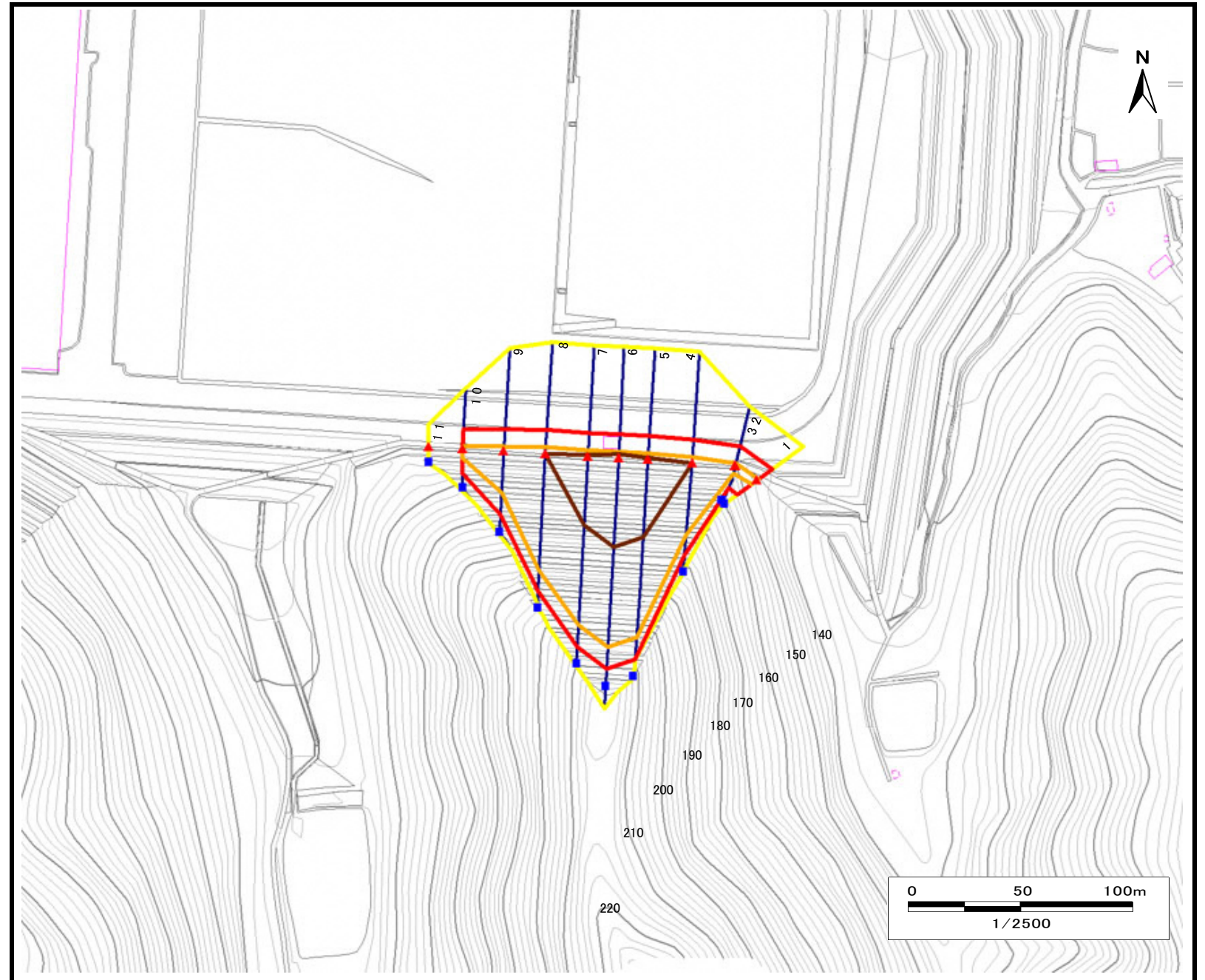
土砂災害警戒区域・土砂災害特別警戒区域 区域図