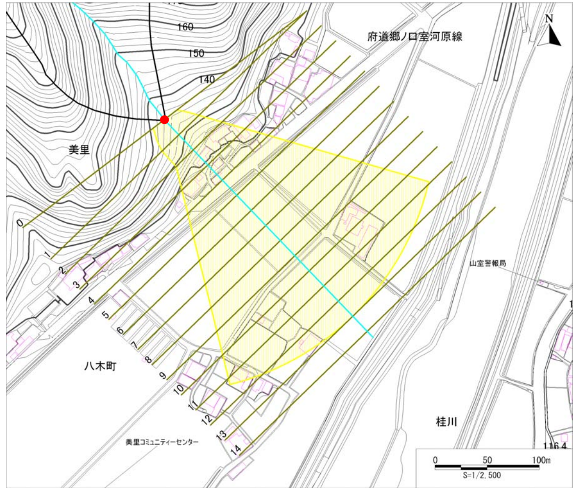
土砂災害警戒区域・土砂災害特別警戒区域 区域図