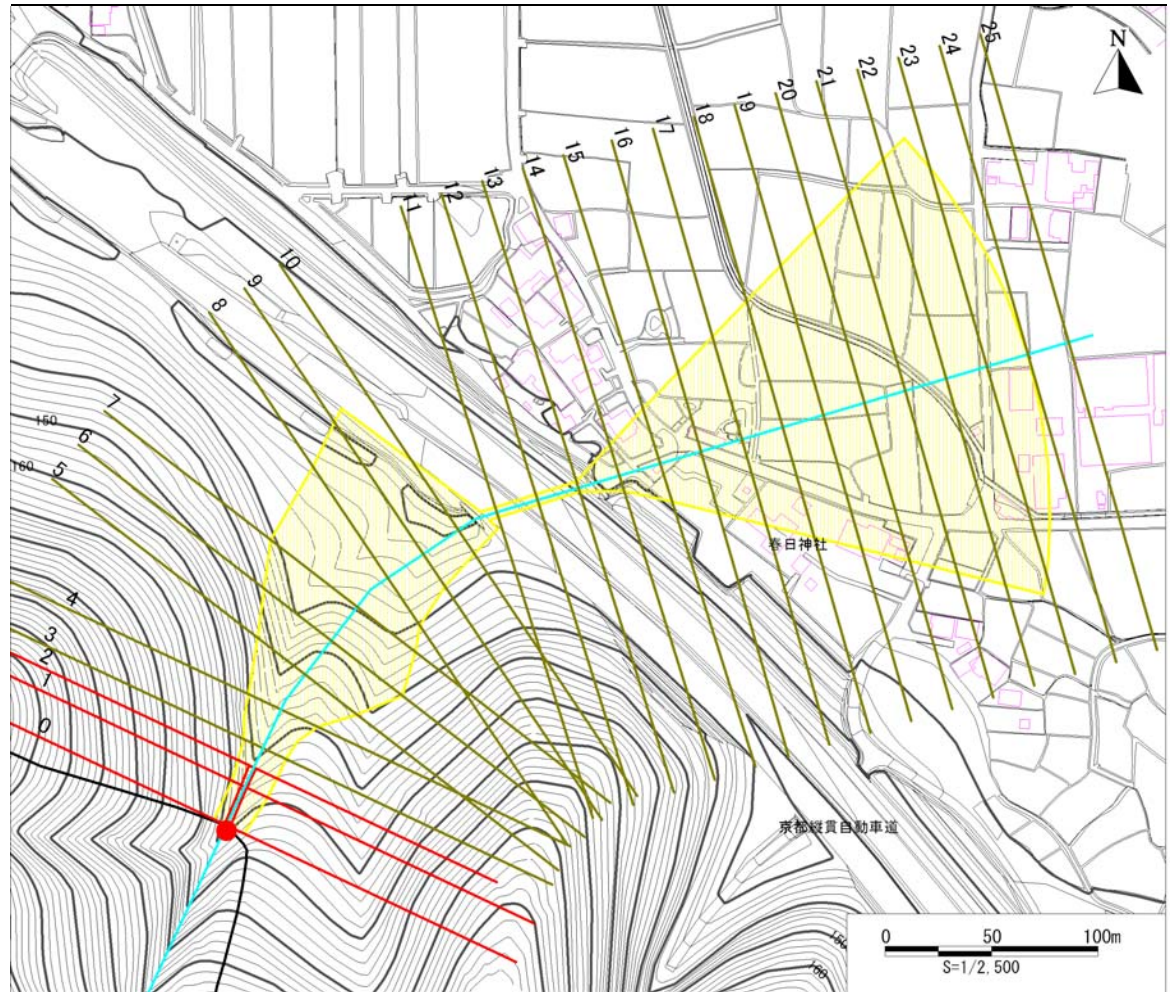
土砂災害警戒区域・土砂災害特別警戒区域 区域図