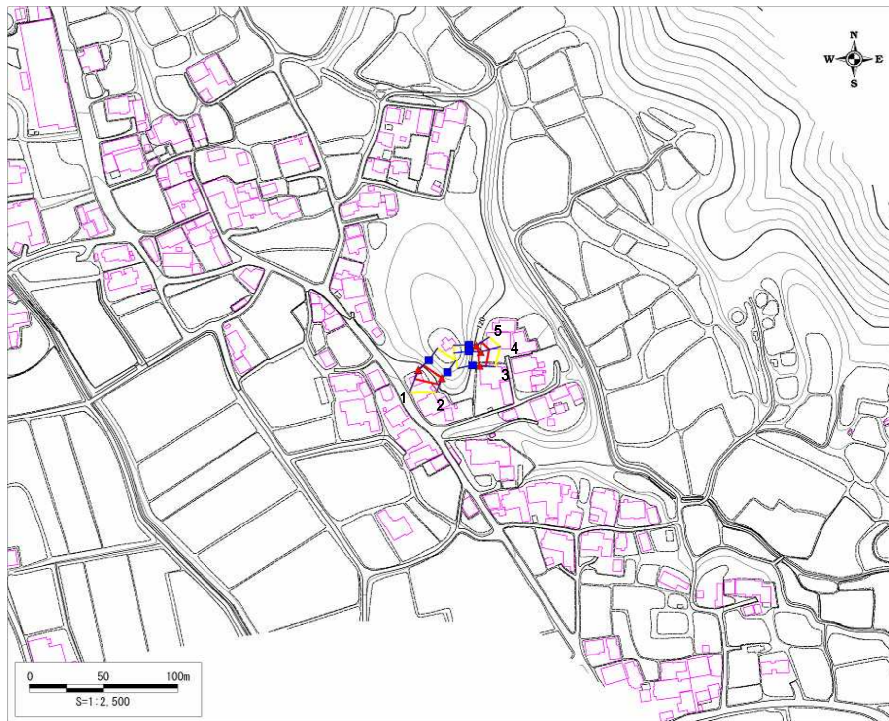
土砂災害警戒区域・土砂災害特別警戒区域 区域図