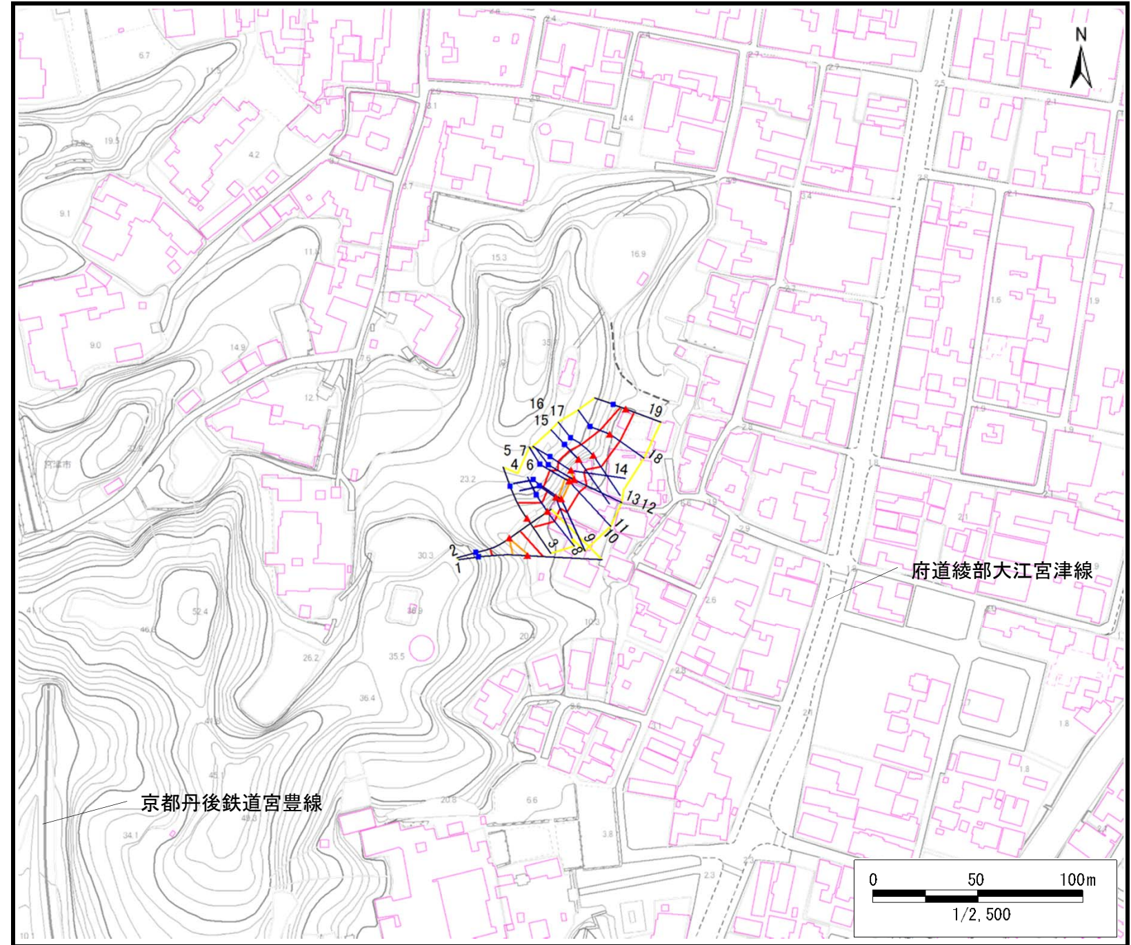
土砂災害警戒区域・土砂災害特別警戒区域 区域図