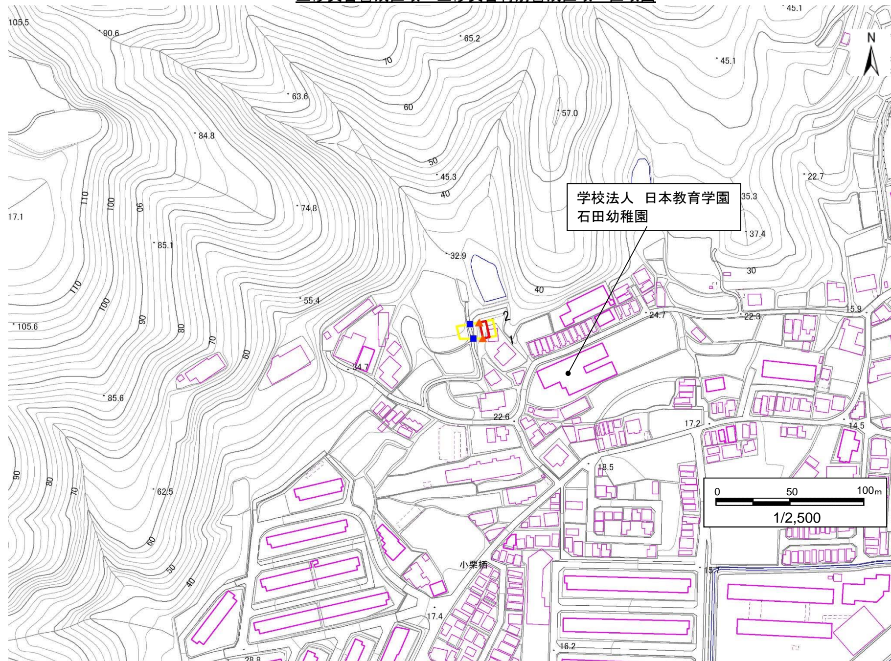
土砂災害警戒区域・土砂災害特別警戒区域 区域図

この地図は、国土地理院長の承認を得て、同院発行の数値地図25000(地図画像)を複製したものである。 (承認番号 平22業複、第580号)