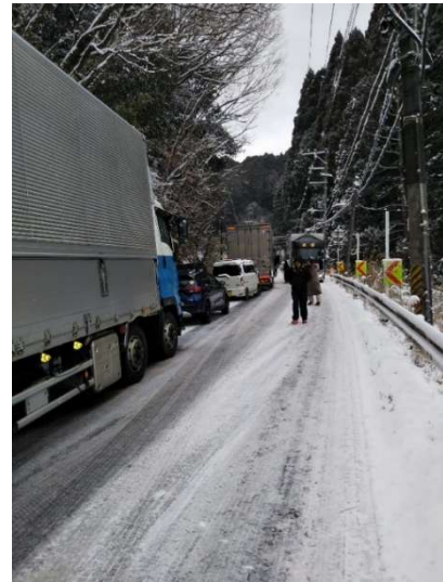
離合が難しくなった様子