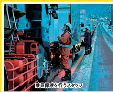
令和7年3月 山梨県内国道20号における 車両滞留の発生状況