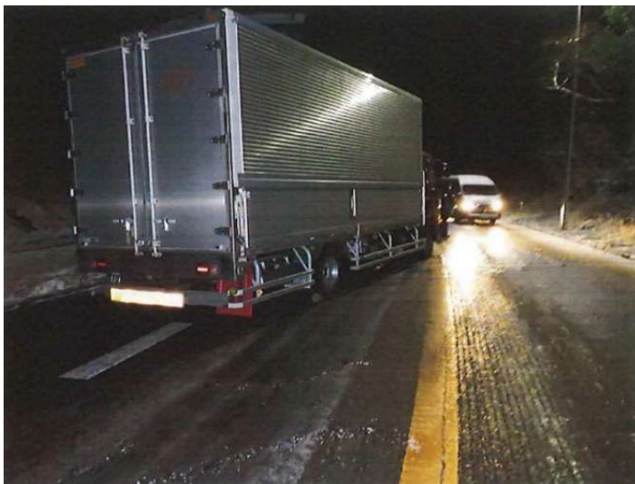
スタックした大型車