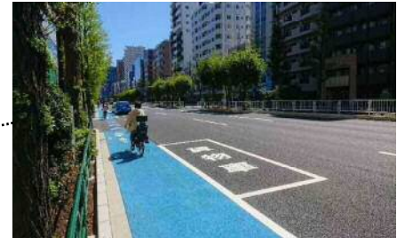
都道301号(白山通り) ※自転車通行帯の車道側に停車帯を設置