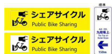
<案内看板の統一仕様案>

シェアサイクルの利用場所を容易に認識できる環境構築のため、案内看板の仕様・設置基準の統一について検討し、鉄道駅等における案内看板の設置を促進します。