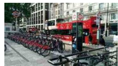
<道路上への配置(ロンドン)>

公共用地へのサイクルポート設置促進に向けた規制緩和、ルールの明確化について検討を行い、道路上等利便性の高い場所へのポートの設置を促進する