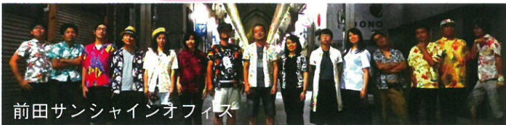
前田サンシャインオフィス

関西を中心に各方面で活躍するバンドから、選りすぐりのメンバーが集まり結成。総勢14名が織り成す分厚い音と愛溢れる楽曲、ライブが魅力です。