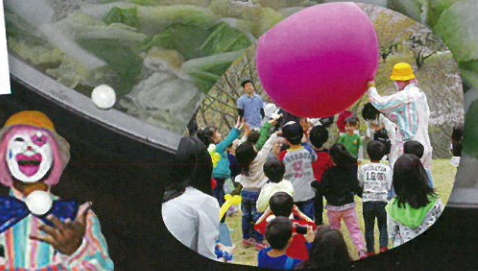
極楽ピエロさん、ラストステージとなります