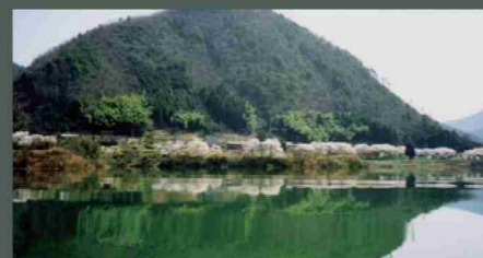
榎原運動公園 ⑧：運動公園、多目的広場、桜、モミジなど。