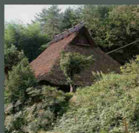
石田家 ⑤：1650年の建設、日本最古の農家と言われ、重要文化財。