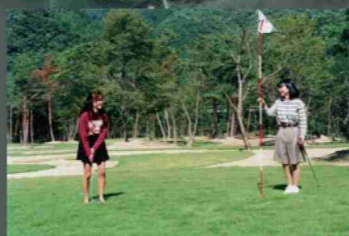
向山パターゴルフ場 ⑨：36ホールふれあい広場付近からのポート渡船可。