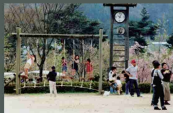
大野ダム公園 ③：緑地公園、多目的広場、桜、モミジ、紫陽花など、(お祭り、わんぱく、時計台、ふれあい)広場