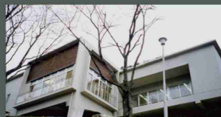
大野ダムビジターセンター：2000年4月に開館、大野ダムを知ってもらうための資料の展示及び、来者の休息スペースとして建設された。