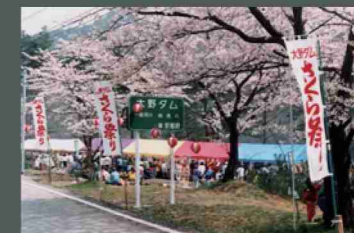
桜まつり：毎年4月上旬から中旬の満開期に開催される。模擬店や特産品市、青空野菜市場など、盛りだくさんの企画。