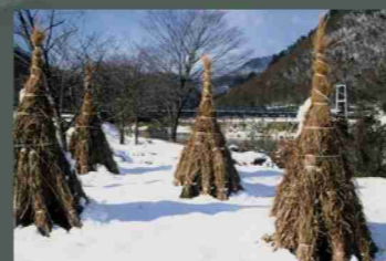
向山公園 ⑩：緑地公園、多目的広場。