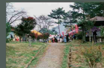
紅葉まつり：毎年11月上旬から中旬の紅葉時に開催される。桜まつり同様の企画。