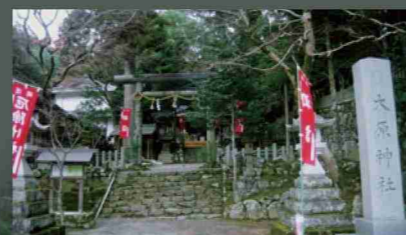
大原神社 ⑥：伊弉冉尊をまつり、孝徳天皇の代に創建。奉納芸として「カラス田楽」が保存。府道の路肩にケヤキの巨木がある。府の銘木200選の1本。