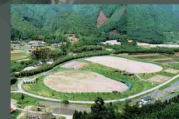
長谷総合運動公園 ⑫：運動公園、野球場、総合グラウンド、ゲートボール場。