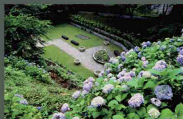
大野ダム公園 ②：緑地公園、ベンチ、桜、モミジ、シャクナゲ、紫陽花、水仙、虹の広場、お花畑。