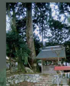
大川神社のねじれ杉 ⑦：根本部分が大きくねじれている珍しいもので、天然巨木は神木の風格をそなえている。