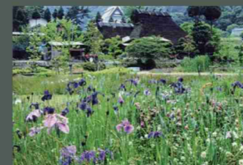
岩江戸公園 ⑪：緑地公園、多目的広場、ゲートボール場、湿性植物池、トンボ池。