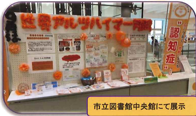
市立図書館中央館にて展示

つなげ隊員所属の事業所（ひだまりデイサー ビス、駅南ニコニコハウスりんご村、厚ニコニ コハウス、豊の郷）のデイサービス等でお花紙 を使って折って いただいたお花 約800個でタ イトルの文字を 作りました。