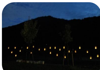
高齢者施設の外周フェンスに つり下げて・・・