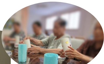
デイサービスの ご利用者様とともに・・・