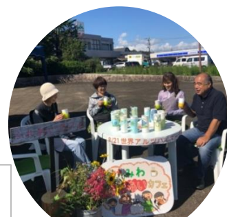
みわふれあいカフェにて 一般の方も参加