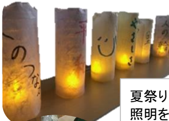
夏祭りの際、 照明を落とし