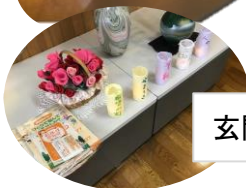
玄関内でおもてなし