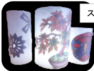
スタンドグラス風