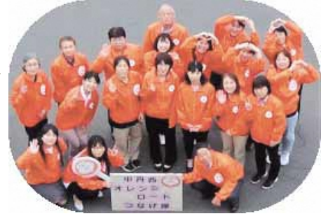
認知症のことをたくさんの人に知ってもらうため、現在40名の隊員で活動しています。

認知症の人を理解し、支援していくためにはどうすれば良いのでしょうか？ 超高齢化社会を迎えた今、誰もが認知症にかかわる時代に入っています。 優しさと思いやりを持って、地域で協力し、見守ることや、認知症への理解を広めることにより、認知症になっても安心して生活できるまちづくりにつなげていきましょう！