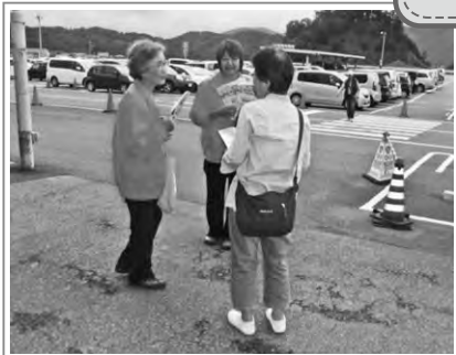
9/21世界アルツハイマーデー 福知山城のオレンジライトアップに合わせて イオン福知山店様で啓発活動

認知症啓発用DVD 「地域で支えよう認知症 ～オレンジロードつなげ隊からの発信 in ふくちやま～」を制作中!!