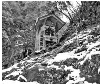
岩戸山の様子 (2016年3月)