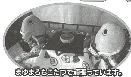
まゆまるもこたつで頑張っています。