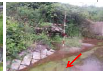
祖母谷川(堂奥) 護岸の欠損