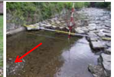
祖母谷川(多門院) 河床張コンクリートの破損