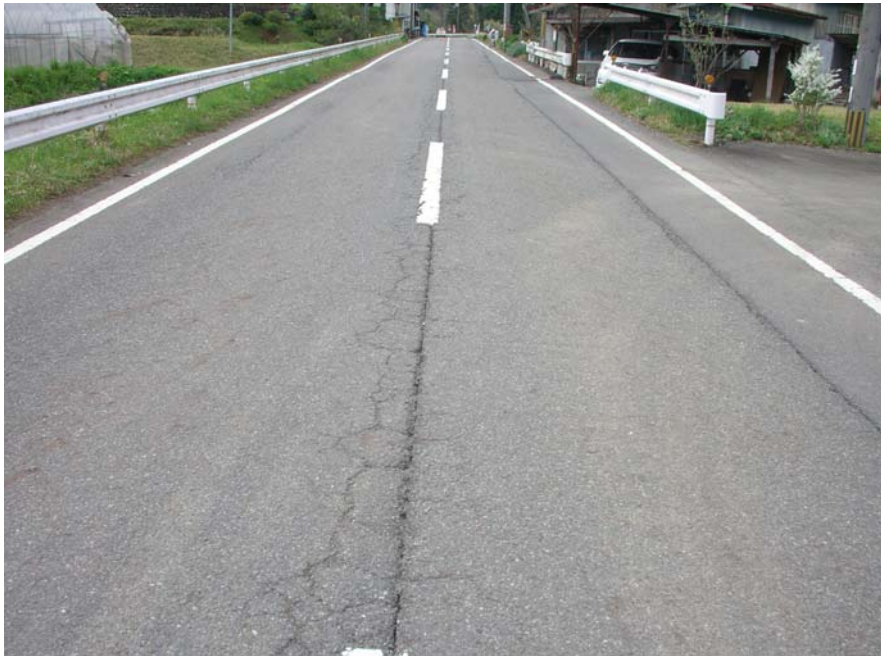
⑥談夜久野線 福知山市夜久野町末 舗装損傷状況 2