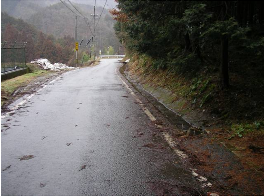
⑤山東大江線 福知山市夜久野町平野 側溝現況 1