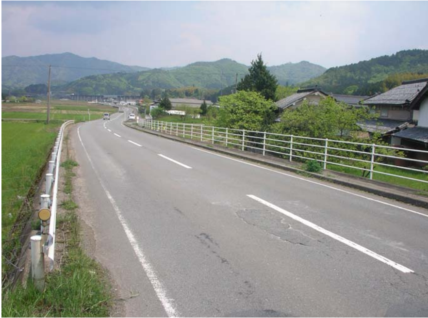
③岩崎市島線 福知山市宮地内 舗装損傷状況（全景）