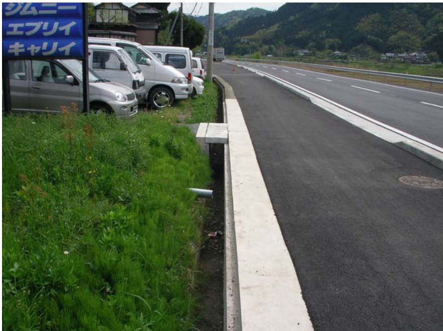
④国道175号 福知山市大江町三河地内 側溝現況1