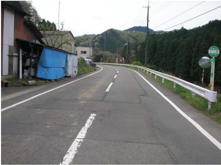
⑥談夜久野線 福知山市夜久野町末 舗装損傷状況 1