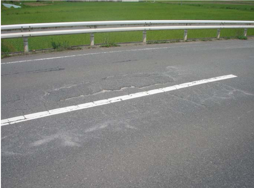
③岩崎市島線 福知山市宮地内 舗装損傷状況 2