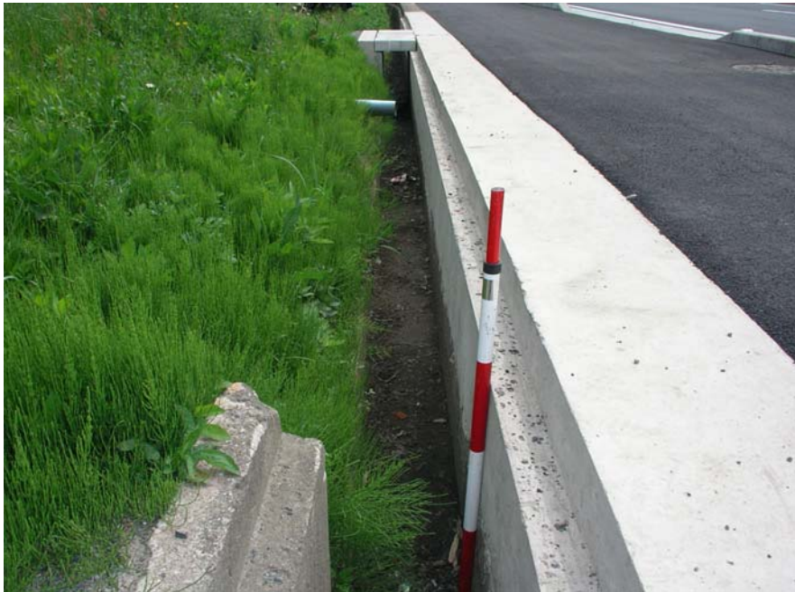
④国道175号 福知山市大江町三河地内 側溝現況2