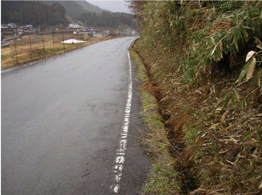
⑤山東大江線 福知山市夜久野町平野 側溝現況 2