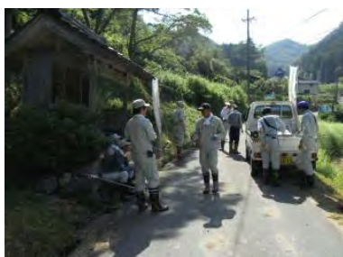
▲作業休憩時の交流