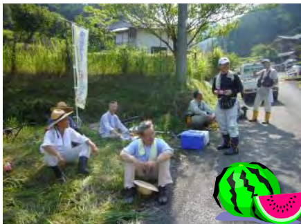
自治会長からスイカをいただき休憩♪