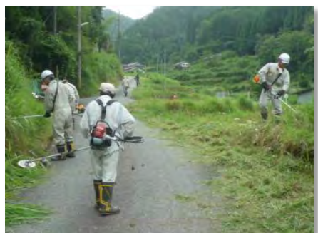
道路の草刈り(金谷)