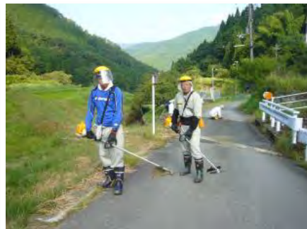
長田野ガスセンターの方々