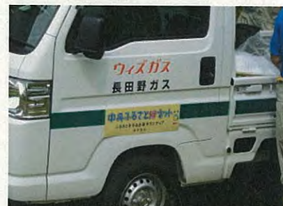
絆ネットのステッカーです