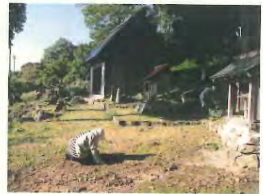
地元のお母さん方も参加しました。