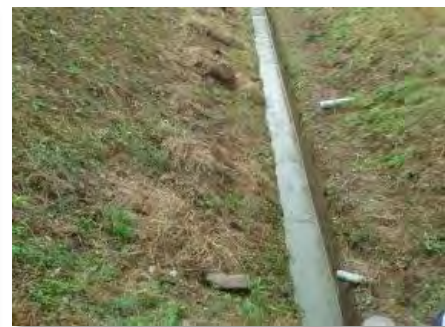
きれいになった水路