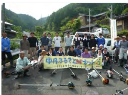
参加者記念写真(金谷)