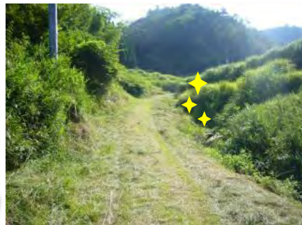
きれいになりました。