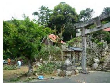
▲八幡宮の鳥居周りの剪定