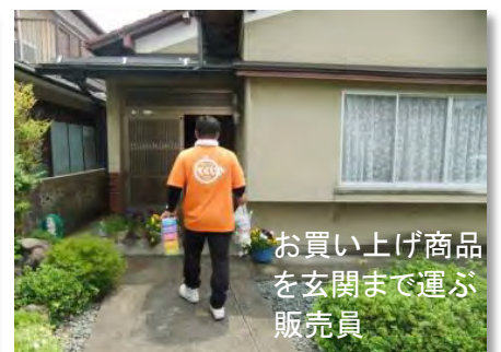
お買い上げ商品 を玄関まで運ぶ 販売員

申込みがあった家を週に2回巡回。「4日後にも来るから買い溜めしないでね」と買いすぎ注意の言葉かけもありました。