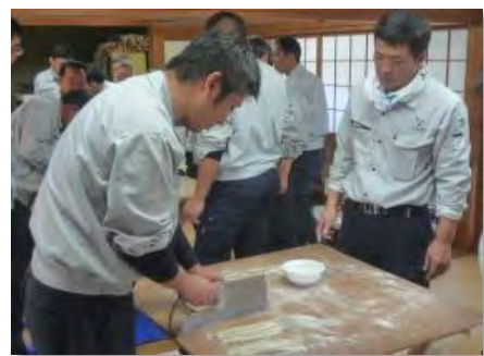
そば打ち体験(細く切る)