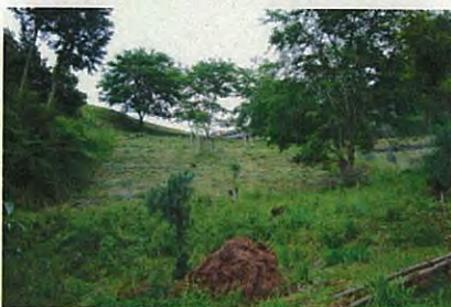
草刈りが終わりすっきり