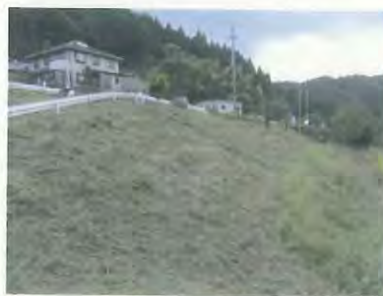
作業後の法面の様子