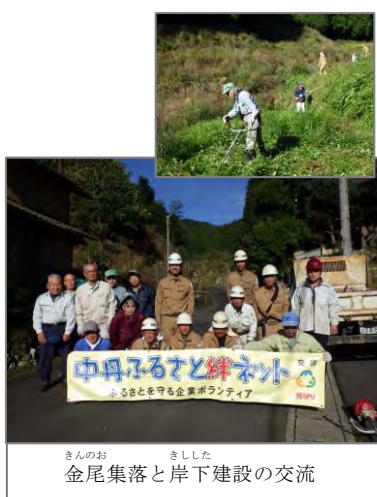
きんの お きしした 金尾集落と岸下建設の交流