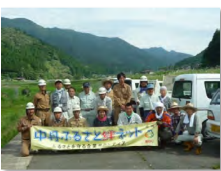
参加者記念写真(三谷)