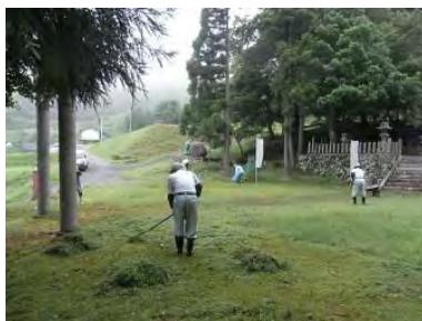
▲八幡宮境内の草刈作業