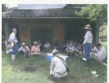
村の将来像等について意見交換