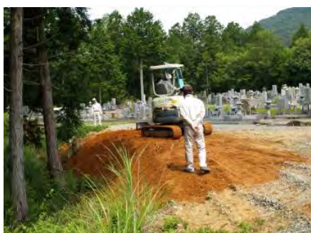
墓地進入路の整備