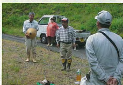
自治会長からのお礼