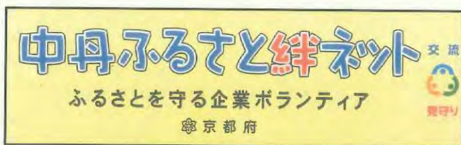
絆ネット・広報資材