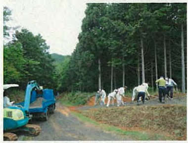
新しい墓地進入路ができました