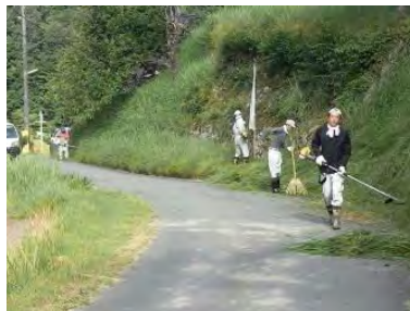
▲公民館隣接道路の草刈作業