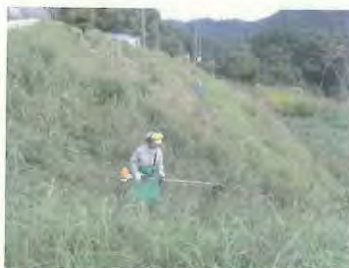
草刈り作業開始です