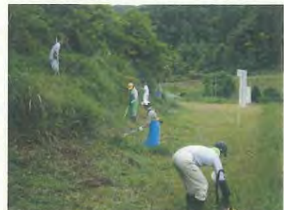
すごいパワーです