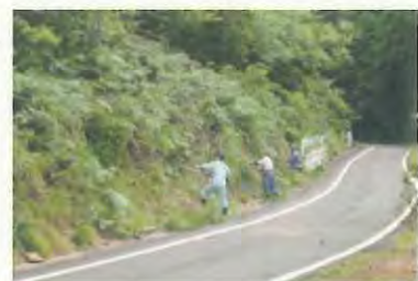
効率よく草刈りができました