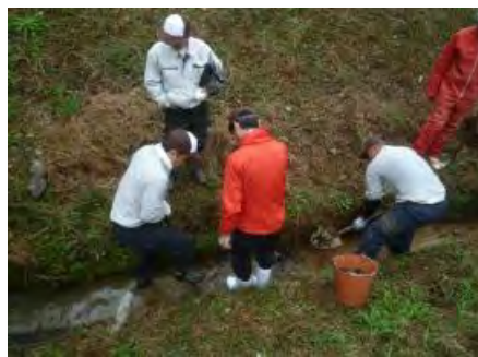
農業排水路の泥上げ・清掃