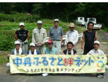
参加者記念写真(現世)