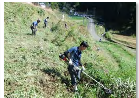
道路法面(植樹帯)の草刈り(小畑)