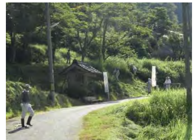
▲地藏さん周辺草刈作業