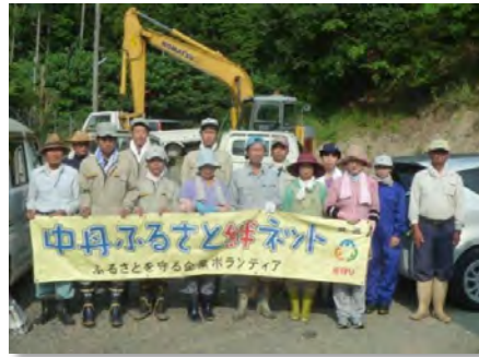
参加者記念写真(新宮)