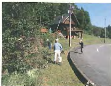
草刈り作業開始です。