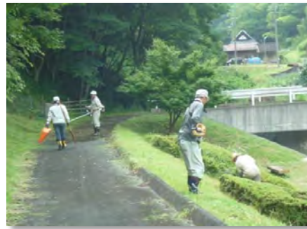
道路法面の草刈り(田ノ谷)