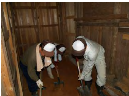
御輿収蔵庫の床整備