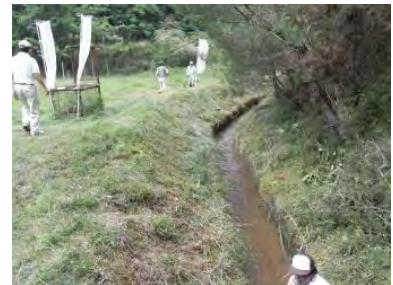
▲外周部の水路(作業後)