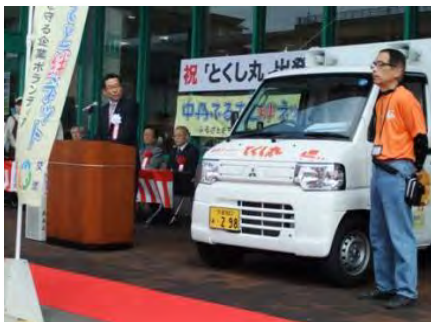
『とくし丸』と販売担当者 紹介