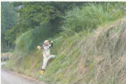
高いところも頑張ります