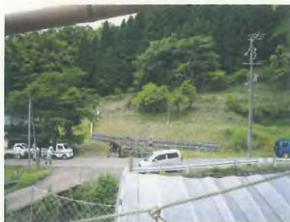
きれいに草刈りができました