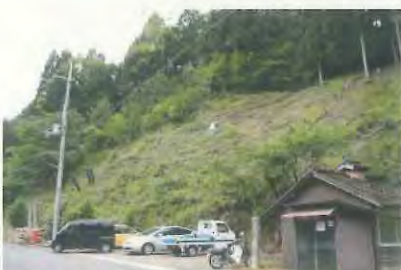
高いところも身軽です