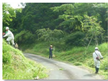
道路脇の草刈り(三谷)