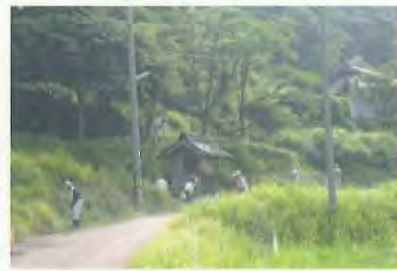
今回は大勢の方がきてくれました