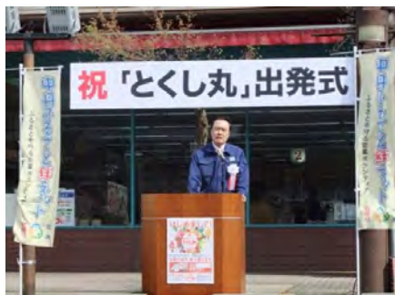
(株)フクヤ 平野社長 あいさつ