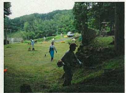
中世の田楽や鬼退治伝説が伝わる御勝八幡宮付近での草刈作業です。（上野条）