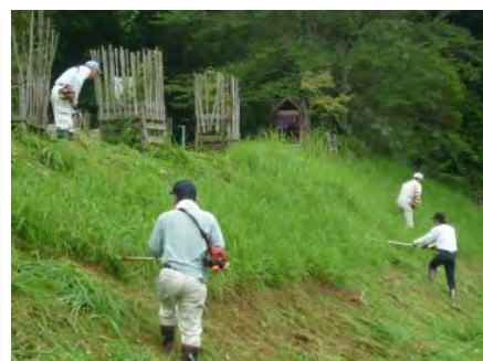
道路脇法面の草刈り(法用)