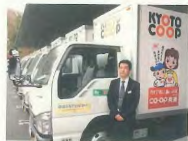
京都生活協同組合