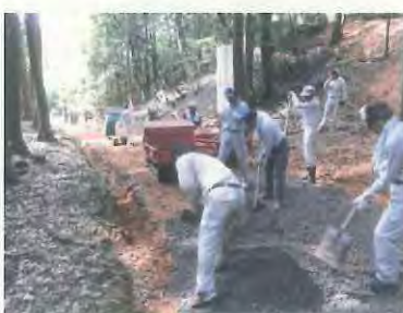
採石を敷いていきます。