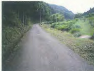
800mもの市道がきれいになりました