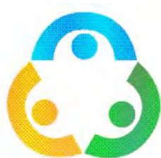
▲絆ネットのロゴマーク