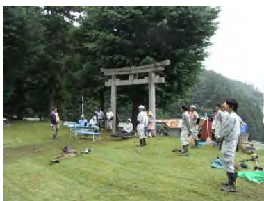
▲作業後の丁寧なお礼