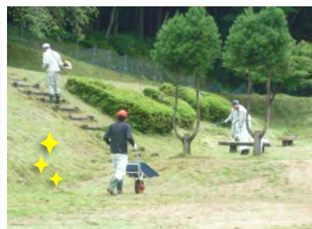
公園の草刈り(田ノ谷)