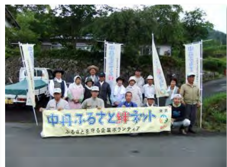
参加者記念写真(喜多)