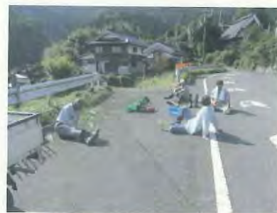
休憩時の交流の様子です

《中丹ふるさとを守る絆ネット推進事業》では、行政、地域住民及び事業者が協定を締結し、見守り活動や農村交流活動を展開し、地域の安心安全な暮らしの確保や農村の活性化を図ることを目的としています。