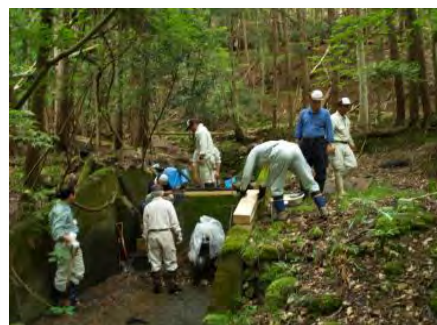
農業用水取水口の堰板更新