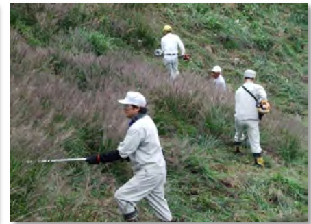
道路法面の草刈り(喜多)