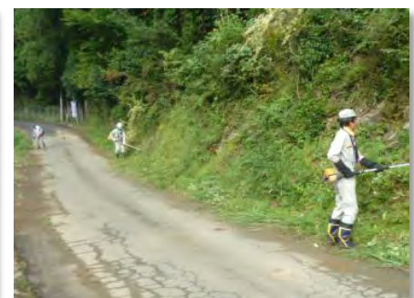
道路脇法面の草刈り(毛原)