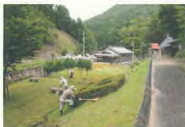
草刈り作業開始です