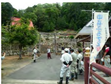
▲作業後はお礼の挨拶で締め