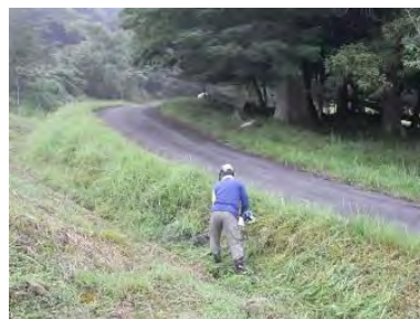
▲八幡宮隣接水路の草刈作業