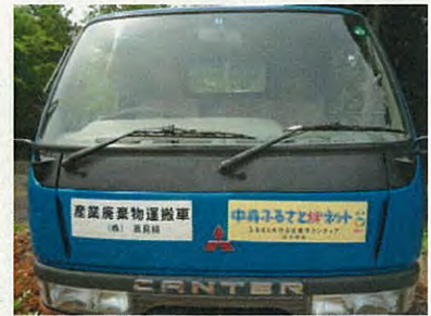
絆ネットのステッカー（右）です