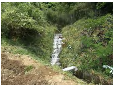
▲階段落差工水路(草刈)