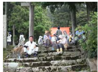
▲作業休憩時の交流