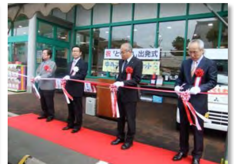
出発式テープカット