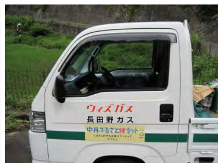
「ウイズガス」長田野ガス