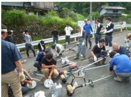
刈払機の準備をする社員の方々