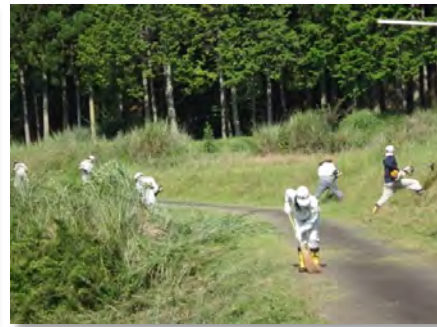
道路法面の草刈り(坂室)