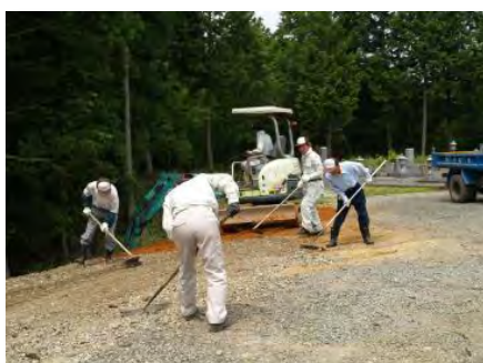
墓地進入路の整備