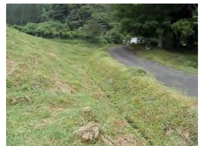
▲草刈作業後の水路