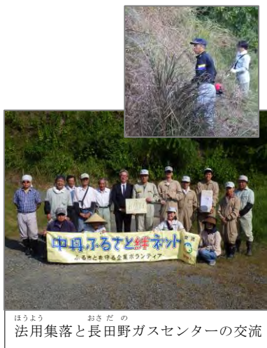
ほうよう おさだの 法用集落と長田野ガスセンターの交流

企業の社長さんからは「こうしたボランティアの参加は社員教育の一環となり、地域のあり方を考える機会となり大変勉強になる。」といった言葉をいただき、企業と集落を結びつける農村交流活動の必要性を改めて感じました。