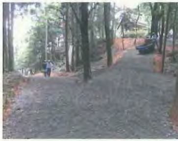
200mもの作業道が仕上がりました。