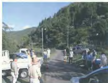
草刈り作業開始です