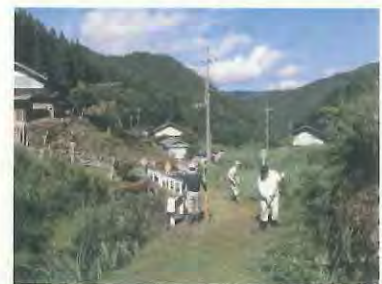
今回も大勢の方がきてくれました