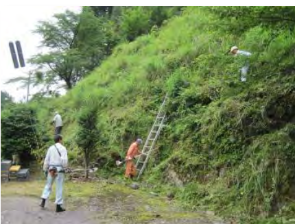
公民館周辺の草刈り(田ノ谷)