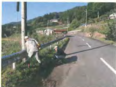
長い延長も身軽です。