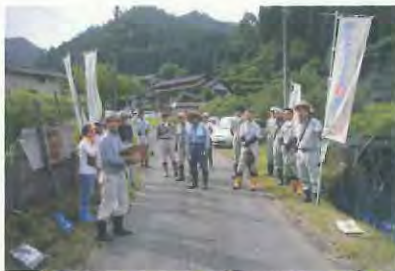
草刈り作業開始です