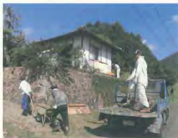
砂利運搬の開始です