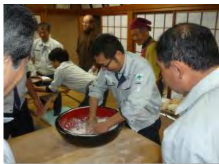
そば打ち体験(そば粉を練る)