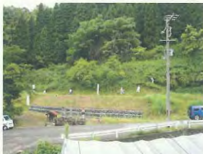
草刈り作業開始です