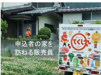
申込者の家を 訪ねる販売員

【(株)フクヤと舞鶴市、京都府中丹広域振興局は、「中丹ふるさとを守る活動（見守り）」に関する協定を締結しています】