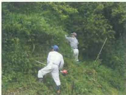
どんどん作業が進みます