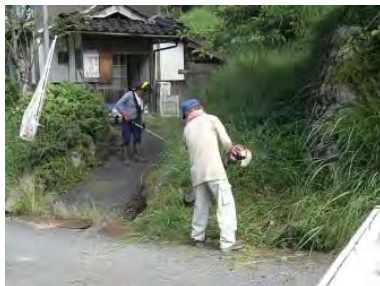
▲公民館回りの草刈作業