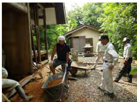
御輿収蔵庫の床整備

・地域の方々と交流しながらの作業は充実感も味わえる上、地元喜んでいただきこちらとしてもありがたいと感じる。