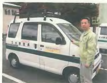
(株)長田野ガスセンター