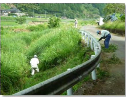
道路法面の草刈り(三谷)