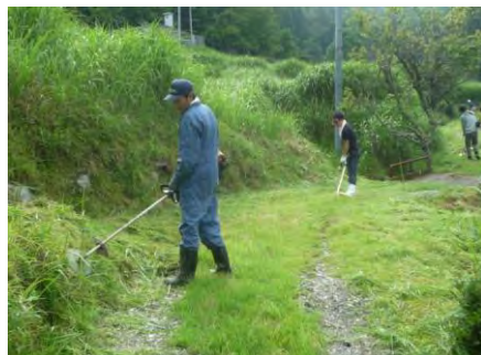
農道の草刈り(金谷)