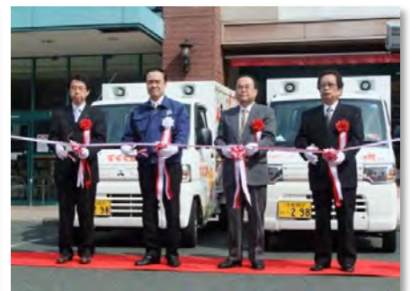
出発式テーブルカット