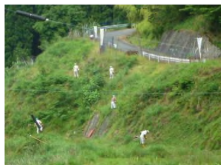
道路法面の草刈り(小畑)