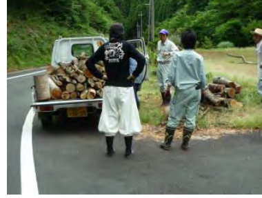
▲集落内の清掃(切株搬送)