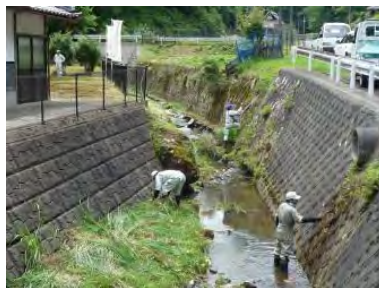
▲水路内の草刈作業