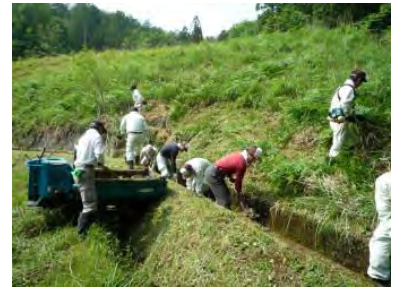
▲ため池下の水路土砂撤去