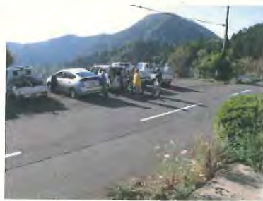
雲海を見ながらの休憩です。