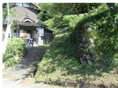
▲草刈り後の公民館