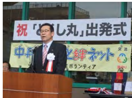
(株)フクヤ代表取締役専務あいさつ