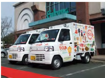
始動した2台の『とくし丸』