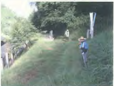
生活道路など3カ所で草刈