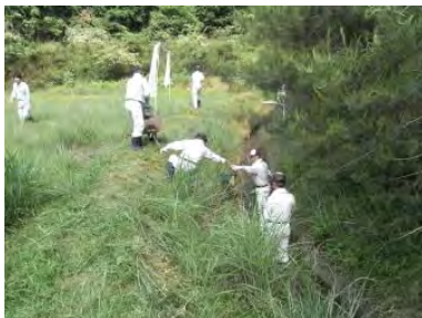
▲外周部水路清掃(作業中)