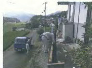
浮き上がった犬走りの補修