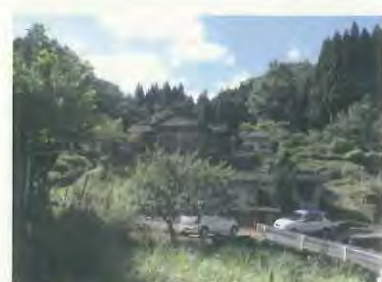
空き家と耕作放棄地が目立ちます

《中丹ふるさと再生推進事業》は、中丹管内の過疎化・高齢化が進む農山村集落が、地域活性化に向けて自主的に取り組む「都市農村交流活動」や「村おこし活動」等の取り組みを支援しています。