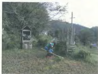
細かい所も丁寧です