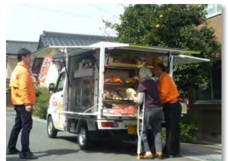
移動スーパー『とくし丸』(東舞鶴地区)の活動状況 【平成26年4月1日】