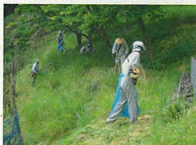
みんなで頑張ります