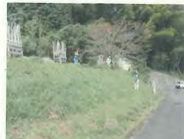
効率よく草刈りができました