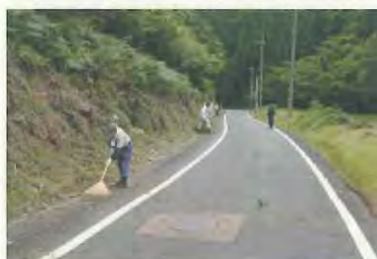
作業後の後片付けの様子