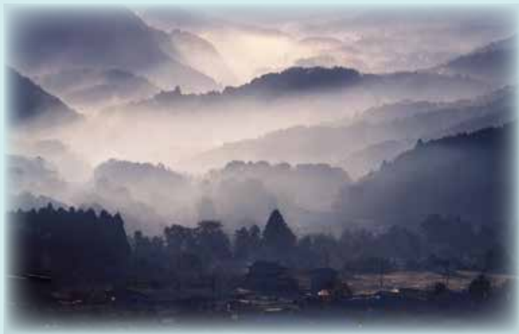
「雲海の里」(撮影場所:福知山市夜久野町宝山)