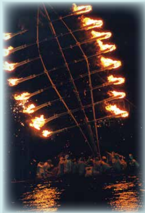
「希望の灯」(撮影場所:舞鶴市吉原)