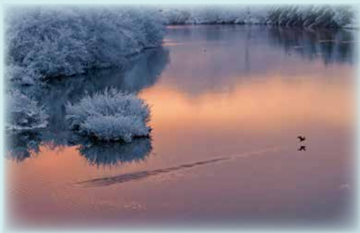
「由良川淡雪の朝」(撮影場所:綾部市位田町)