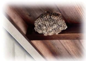
▲軒下にてきたハチの巣

食べ物などの誘引物を狙って屋内に侵入することがあります。 建物内に侵入できる隙間も無くしましょう。