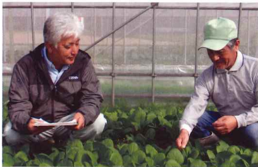
計画出荷に向け事務局(左)が生育状況を確認