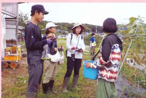
収穫体験を通じ農業の魅力をPR

引き続き、経営感覚に優れた担い手の育成と、多様な方々が農業に関わり、補完・協力し、地域を支える取組みを行います。