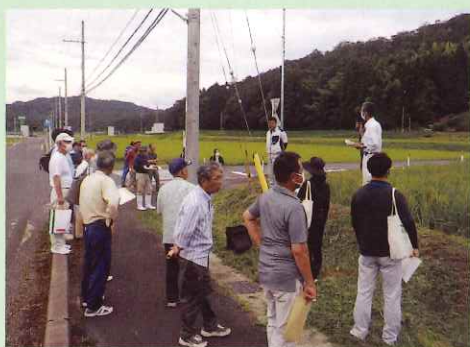
京丹後市の生産者から栽培のポイントを学ぶ