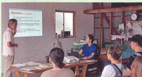
福知山市内の非農家に対し、組織の概要について説明する農事組合法人の代表