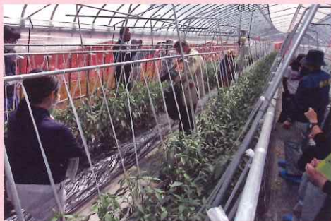
万とうゼミでは生育状況を見ながらリアルタイムでの管理を学ぶ

産地化を進めるえびいもでは、展示ほ場を活用し、えびいも栽培特有の土入れをはじめ、基礎技術習得に向けた栽培講習会や、重労働で手間のかかる作業の機械化実証に取り組ましました。今後も省力機械化栽培の確立に向け、取組みを継続します。