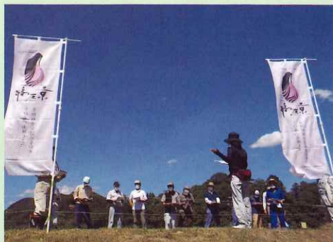
京式部現地講習会で栽培の注意点を説明

普及センターでは、令和3年度からの3年間で、試験ほ場の設置や講習会等を実施し、収量・品質を確保できるように支援を行いました。今年度の中丹地域の京式部の一等米比率は、コシヒカリよりも高く、農家からは良食味でコシヒカリよりも倒れにくい品種であると評価されています。普及センターではこれからも、安定した収量・品質の確保に向けた支援を継続します。