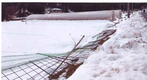
積雪によりなぎ倒された防護柵