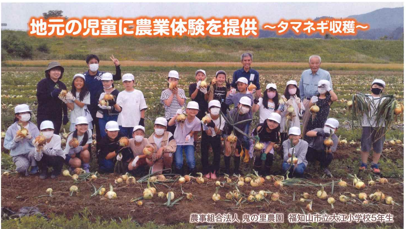
農事組合法人 鬼の里農園 福知山市立大江小学校5年生