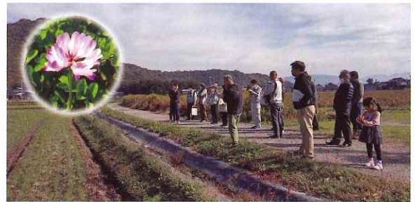
先進地である滋賀県でノウハウを勉強

普及センターでは、緑肥について理解を深める勉強会や、緑肥の窒素量の推定、水稲の生育調査などを通じ、緑肥活用のノウハウ確立に向けた支援を行っています。