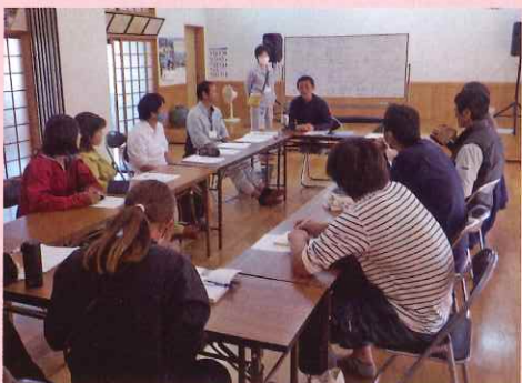
講師からは「働きやすい職場環境づくりには日々の声掛けが大事」との意見