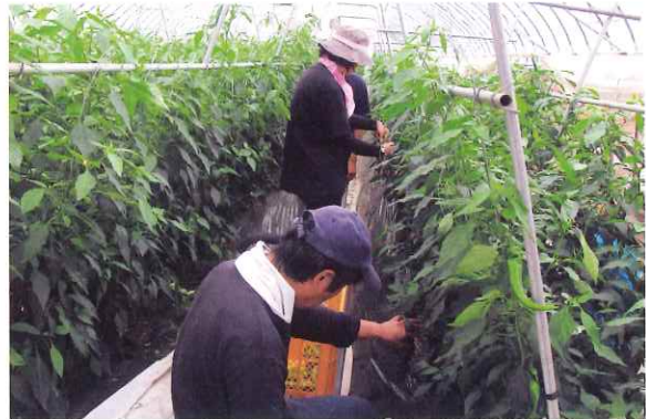
万願寺甘とうの収穫作業を行う利用者のみなさん