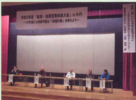
「集落・地域営農推進大会 in 中丹」では、組織の後継者対策について全体で討議

また、昨年11月29日に行った「集落・地域営農推進大会 in 中丹」の中で、普及センターから後継者確保の事例を紹介するとともに、全体討議でも後継者確保対策を取り上げて、議論を深めました。