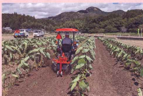
手作業で労力のかかる土入れ作業を機械で実証中