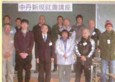
中丹新規就農講座

農業に取り組む上で必要となる農業の基礎知識を得ただけだと、平成22年度から毎年秋頃に農業基礎講座を開催しています。