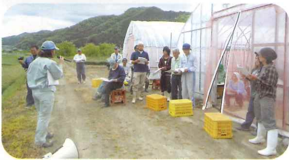
水害後も安定生産を目指して講習会

茶を開始するにあたり不安もありましたが、何とか一番茶を終え、復興の第一歩を踏み出すことができました。