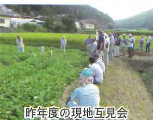
昨年度の現地互見会

しかし、近年は高齢化、担い手不足により面積 が減少傾向にあることから、生産量の確保のため 法人、集落営農組織などによるコンバイン収穫を 行う機械化栽培体系を推進しています。