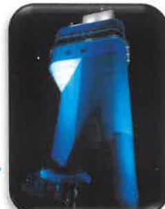
五老スカイタワー