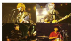
MARLBORO GARAGE 福知山市で活動中の70~80年代のロックを継承したロックンロールバンド