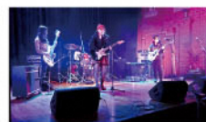
りいとも 日星高等学校の4人組ガールズバンド!