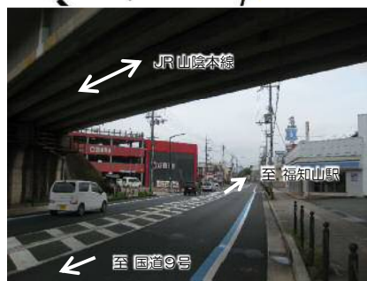
[終点]JR山陰本線交差付近