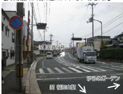
[起点]ゆらのガーデン前交差点