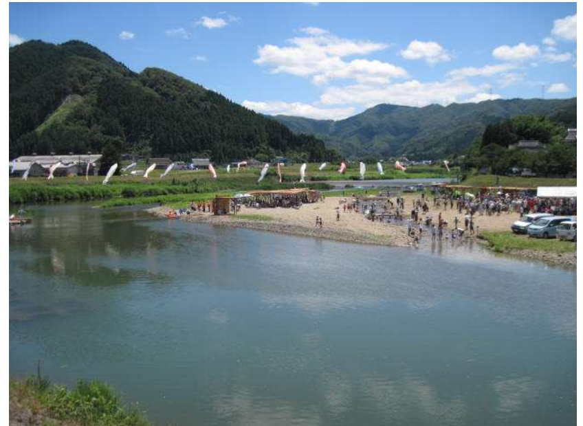
口上林川まつり(平成23年7月17日)