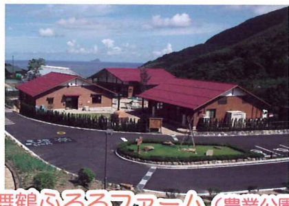
舞鶴ふるるファーム (農業公園)