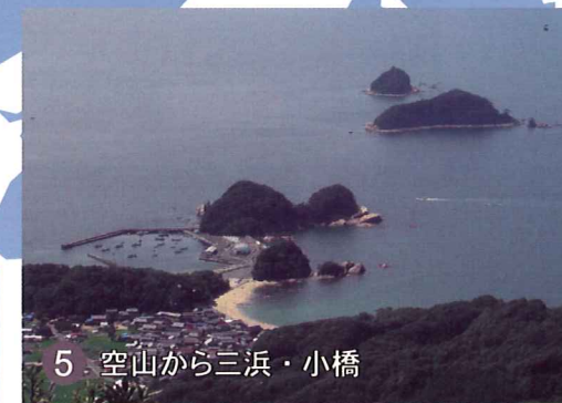
5 空山から三浜・小橋