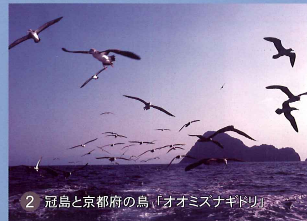
2 冠島と京都府の鳥「オオミズナギドリ」