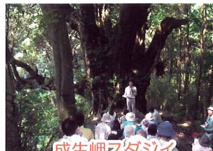
成生岬スタジアム