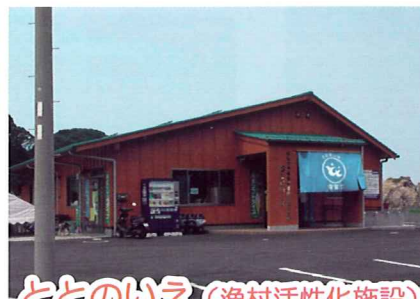
ととのいえ (漁村活性化施設)