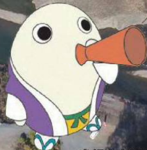
京都府広報監まゆまる