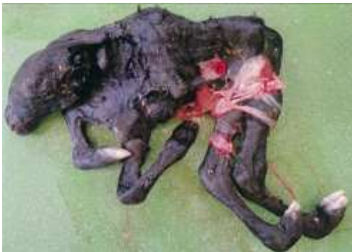
体型異常(ピートンウイルス感染症)