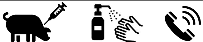
府内野生いのしし豚熱陽性確認状況