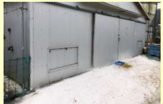
鶏舎周囲の消毒を定期的実施！