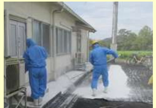
鶏舎周囲の消毒を定期的実施！