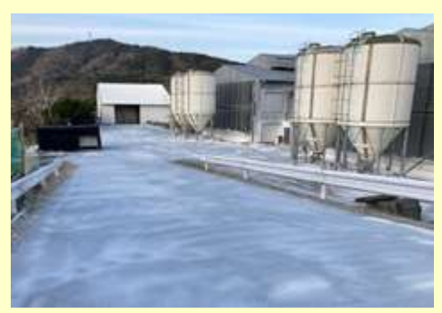
鶏舎周囲の消毒を定期的実施！