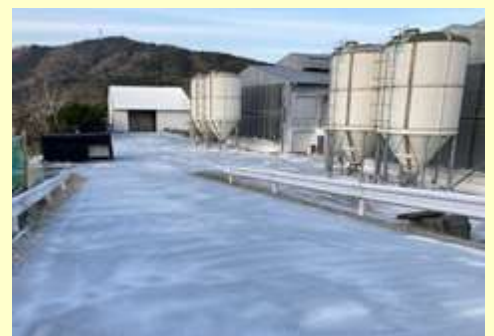
鶏舎周囲の消毒を定期的実施！