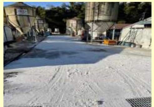
鶏舎周囲の消毒を定期的実施！