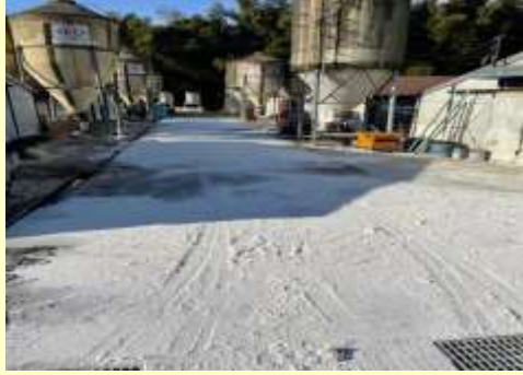
鶏舎周囲の消毒を定期的実施！