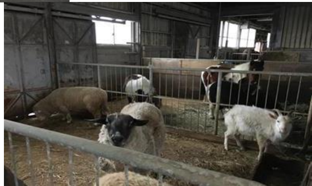
畜舎に帰ってきた山羊、羊