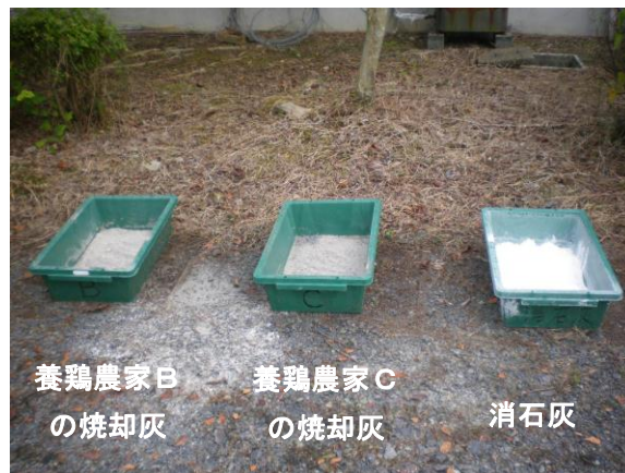
焼却灰の屋外放置試験

今後は、殺菌に関与している物質を調査して焼却灰の特性を解明し、農場周辺の待ち受け消毒に加え畜舎入口での長靴等を消毒する等の適用方法を検討していく予定です。