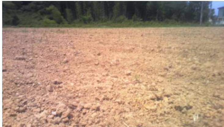
干ばつによる発芽不良のトウモロコシ畑（6 月 17 日）

トウモロコシは、牛の粗飼料とするもので、再播種には高温期に耐性のある品種や他の牧草に変更し、危険回避を行います。