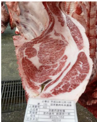
最優秀賞を受けた枝肉