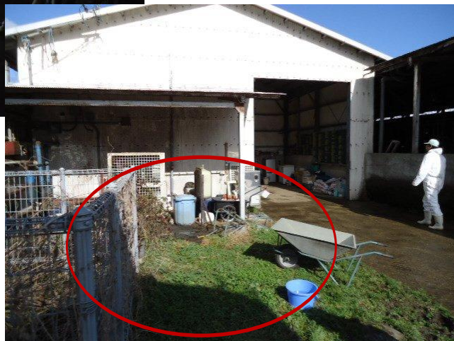
排水処理施設設置予定地（円内）