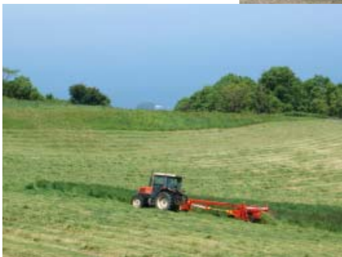
1番草刈り取り作業（碓高原牧場）