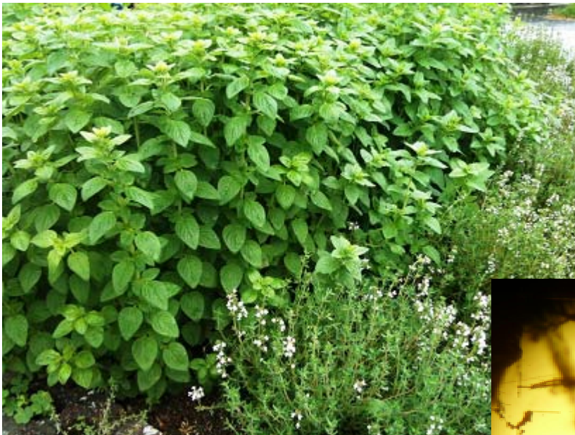
栽培中のハーブ（タイム（手前）とオレガノ）

当センターでは、薬剤抵抗性がなく、安全性の高い天然素材「ハーブ」を利用した防除方法の研究を始めました。