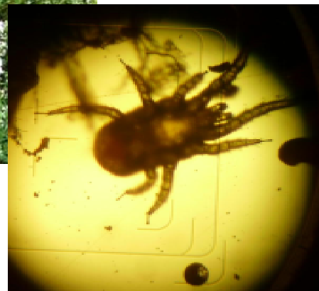
顕微鏡で見たワクモ(体長約1mm)