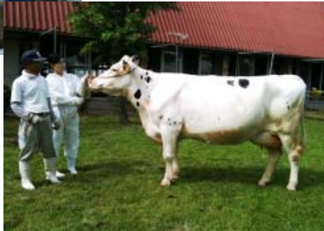
乳器・乳房が高い評価を受けた「オレンジ」号