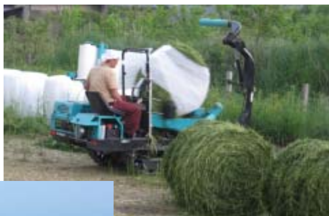
牧草をフィルムで巻いて密封

牧草は、密封保管し、サイレージ（牧草の漬け物）として、秋頃から来春まで牛に給与します。