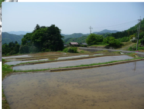
目指すのは中山間地の水田にも適用できる技術体系