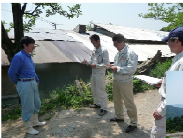
養鶏農家から各専門分野の技術者が聞き取り

今回、飼料米の利用拡大に向けた課題を探るため、飼料米の利用を実践している舞鶴市の養鶏農家を現地調査したところ、飼料米の効率的な保存方法や通常給与している飼料との混合作業などが解決すべき課題であることが明らかとなりました。今後は、それらの課題解決に向け取組みを進めることとしています。