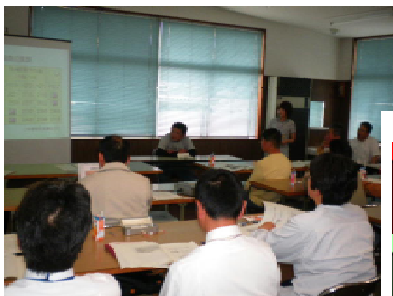
普段特に気をつけていることを中心にした酪農家の発表

参加した酪農家は、なかなか聞くことができない他の酪農家の話しに熱心に耳を傾け、早速取り組もうという意欲が伺えました。