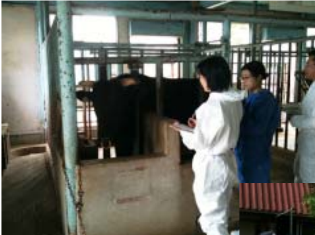
国の種畜検査員が詳細に検査

センターでは、引き続きけい養牛の改良をすすめ、和牛精液と乳牛受精卵の供給及び育成牛の譲渡を通じて農家の牛群改良と経営向上を支援していきます。