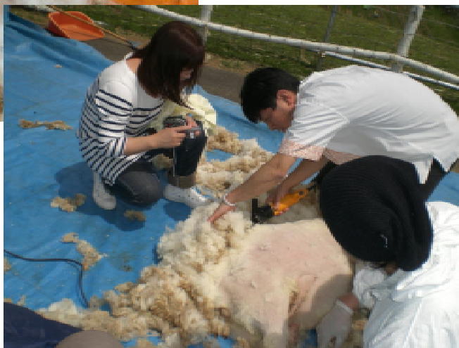
見学者も飛び入りで参加