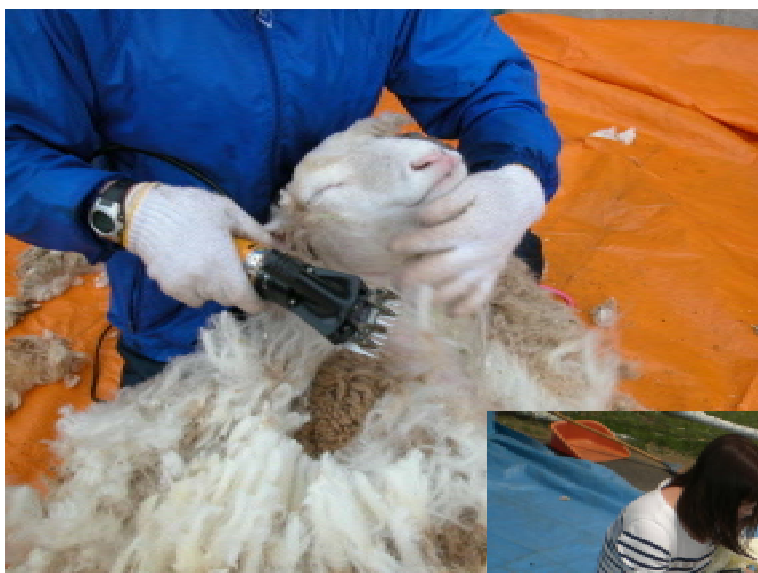
気持ちよさそうに毛を刈られる羊