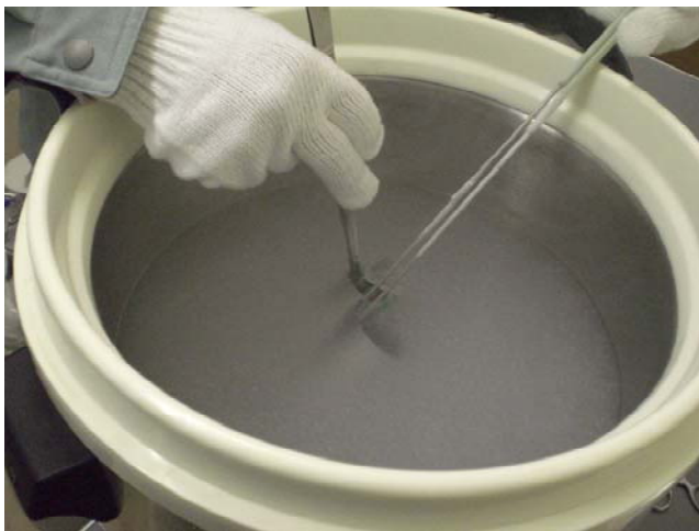
受精卵仕分け作業

受精卵は、主に府内酪農家の乳用牛に移植され、生まれた子牛は和牛子牛市場に出荷されます。