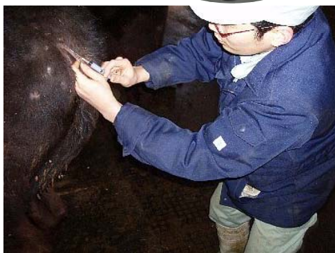
6回の注射が1回で完了