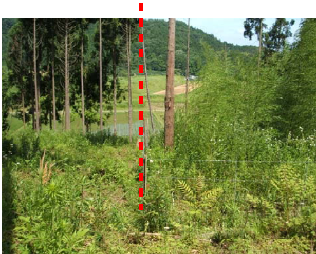
放牧試験地の現況（点線左が放牧、右が非放牧）

採食率は、昨年と同様に90%以上と高く推移し、現時点での発筍ピークは、直立型（地際直径約2cm以上）で4月下旬に、倒伏型（地際直径約2cm以下）で5月中旬と、どちらも昨年より早くなっています。なお、直立型は普通のタケノコに近いものがほとんど無くなり、数も半減しました。