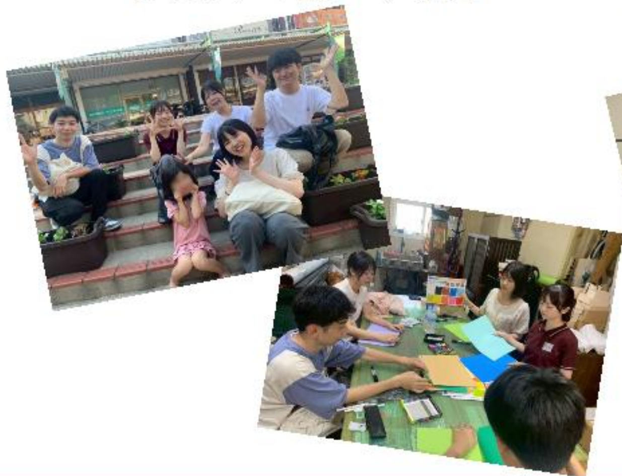
【商店街の鉢植え (7月)】