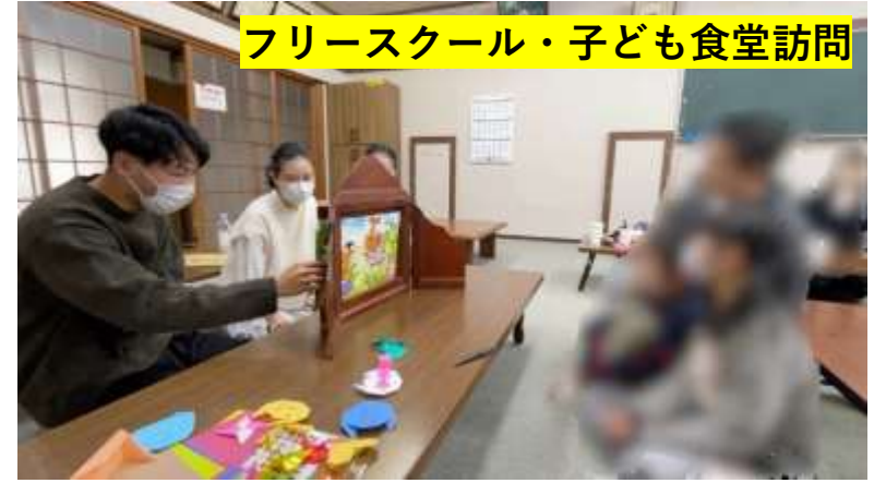
フリースクール・子ども食堂訪問