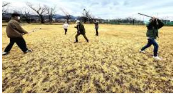
チャンバラの歴史と 研究&殺陣体験