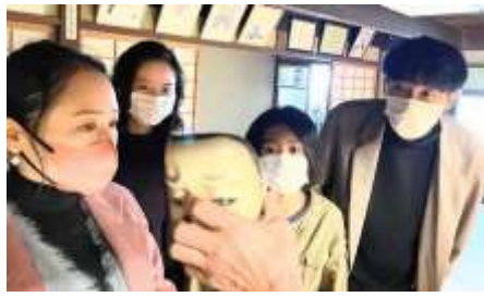
嵯峨狂言体験レポート