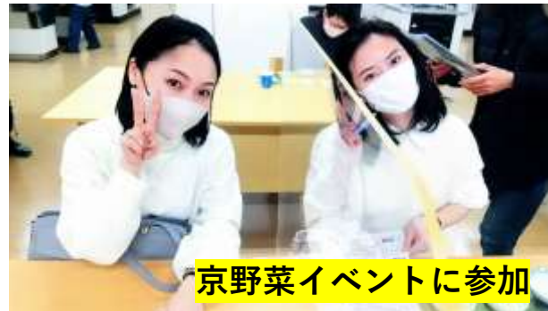
京野菜イベントに参加