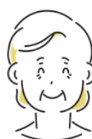
子ども食堂事務局長

スキルの無さや甘さを痛感する日々の中、丁寧にご教示いただきました。何がわかっていないのかに少しずつ気づき、立ち止まり、そこを捕う方法を見つけるきっかけができました。