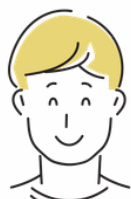
居場所づくり代表

ワークショップ形式で自組織の強みや弱み、戦略について整理をすることができました。安心感のあるファシリテートでありがたかったです。