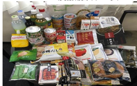
《支援物資イメージ》

(マスク、トイレトーパー、消毒液) 食料品(最大3日分相当、常温保存が出来る保存食のセット)