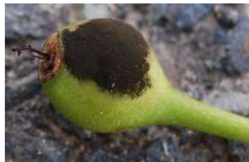
写真2 ナシ幼果での黒星病病斑